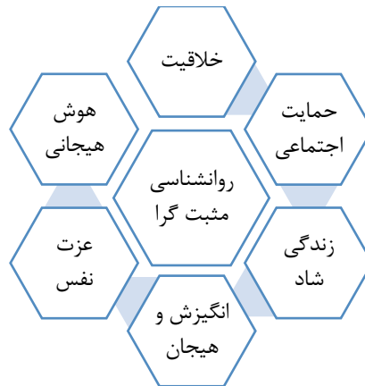
شکل شماره ۲- حوزه های مرتبط با روانشناسی مثبت گرا در مدارس

یکی از حوزه هایی که از اولین روزهای شروع جنبش روانشناسی مثبت گرا مورد توجه این روانشناسان قرار گرفت مدارس و آموزشگاهها بود. باور این روانشناسان بر این است که اگر اصول روانشناسی مثبت گرا همچون خوشبینی، امید، شادی و لذت بردن از زندگی از سنین مدرسه به کودکان و نوجوانان در مدارس آموزش داده شود این افراد در آینده با مشکلات کمتری مواجه خواهند شد (گیلمن، ۲۰۰۲). با توجه به تنوع و گستردگی موضوعات مرتبط با روانشناسی مثبت گرا و تاثیر هر کدام از آن ها بر مدارس و دانش آموزان ابتدا باید حوزه هایی که روانشناسی مثبت گرا در مدارس را نام ببریم: